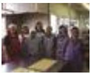
(株) うなづき食工房