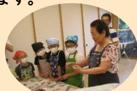
子ども達への食育教室