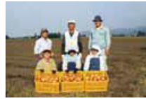
J A となみ野 たまねぎ出荷組合