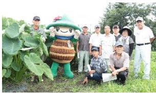
上市町蔬菜園芸協会 里芋部会