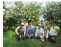
じょうとうかじゆ 上東果樹生産組合