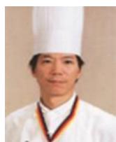
県産食材を使った西洋料理