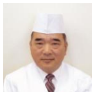
県産食材を使った創作日本料理