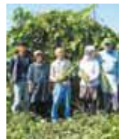
大島町へちま 生産組合