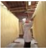
となみ野農協 大門素麺事業部