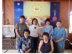
たてやまあしくら 立山芦峯女性の会