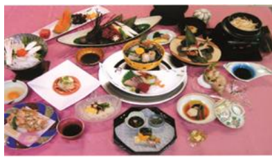
みねやま はやと 峯山 勇人