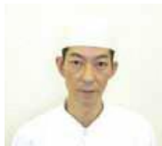
県産食材を使った日本料理