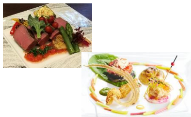
ひろせ まつき 廣瀬 松樹