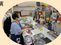
伝承料理 教室の講師