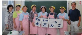
いくじ 生地あいの会