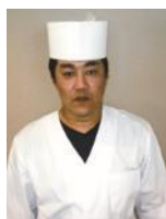
県産食材を使った日本料理