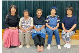
たてやまあしくら 立山芦峯女性の会