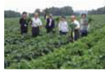
にいかわ 新川大根出荷組合