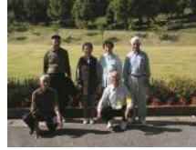
ほそごえ 細越ハトムギ 生産組合