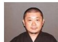
県産食材を使った創作日本料理