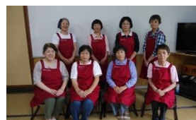
おねえちゃん食堂