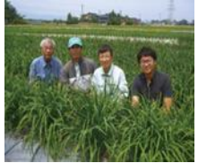
J Aとなみ野 アルギットにら生産組合