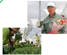
となみきりばな 砺波切花研究会