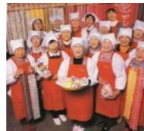
しょくさいこうぼう (農) 食彩工房たてやま