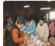
くめくしがき 久目串柿生産組合