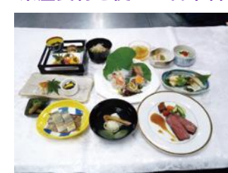
ふじもと しんじ 藤本 伸二