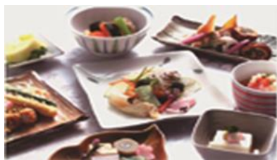
いまじょう ともゆき 今庄 智幸