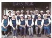
ふくの農産加工 運営協議会