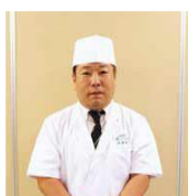
県産食材を使った日本料理