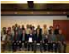
五箇山合掌 みょうが生産部会