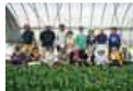
こまつな 菊ちゃんハウス