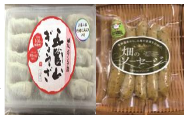
(農)五箇山特産組合 ねこのくら工房