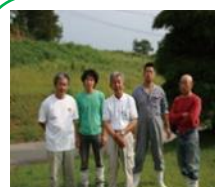
小矢部市 稲葉山牧場