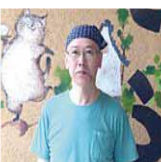
県産食材を使った大豆加工品