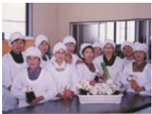
おとがわこう (農) 音川加工