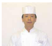
県産食材を使った創作日本料理