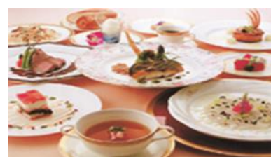
たかまつ やすひろ 高松 康広