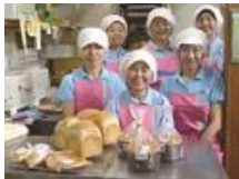
アグリピア パン工房