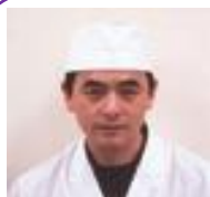
県産食材を使った創作日本料理