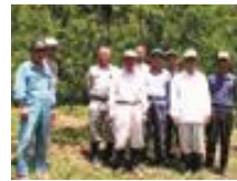
ひみいなづみうめ 氷見稲積梅(株)