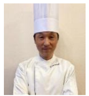
県産食材を使った西洋料理