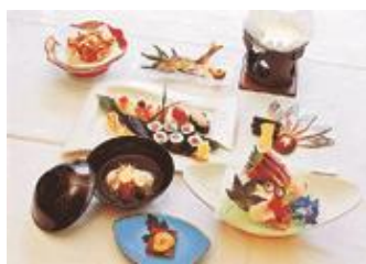
まつだ まさる 松田 勝