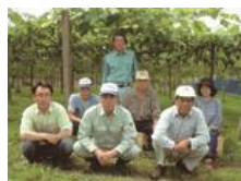
にしふせ 西布施ぶどう組合