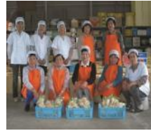
射水市黒河筍 加工グループ