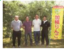
かづみ 加積りんご組合