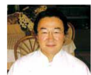
県産食材を使った西洋料理