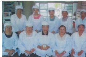
ひかり味噌加工組合