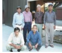
そうこうふじみ 双光藤箕生産組合