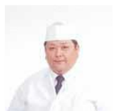
県産食材を使った日本料理