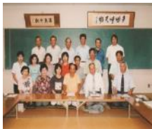
佐野つけもの教室 (佐野地区健康づくり推進協議会)