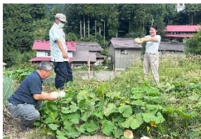
利賀野菜 生産出荷組合