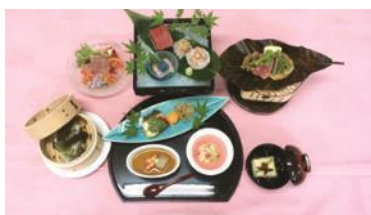
ひこじ りょうご 彦次 亮吾