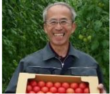
(有)ひかりファーム