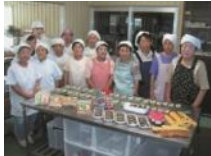
あじさい (農) 味彩おおやま