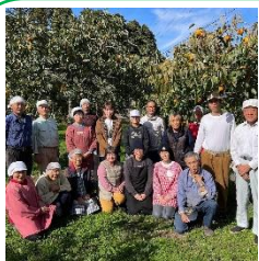
ふくみつがき 福蜜柿生産組合