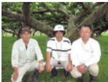
しものがた 下野方梨組合