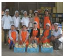
射水市黒河筍 加工グループ