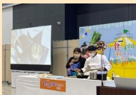
「食の王国フェスタ」での料理実演