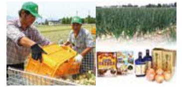
J Aとなみ野 たまねぎ出荷組合