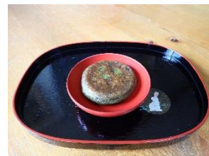
たてやまあしくら 立山芦峯女性の会