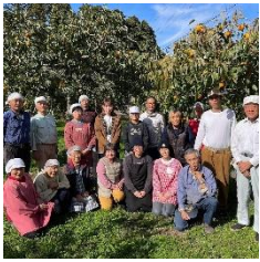
ふくみつがき 福蜜柿生産組合