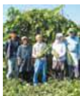
大島町へちま 生産組合