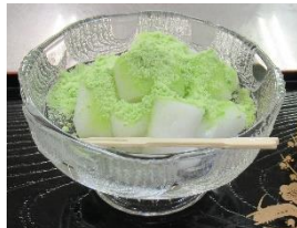
いくじ 生地あいの会