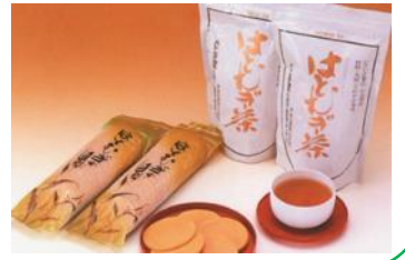
ほそごえ 細越ハトムギ 生産組合