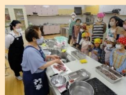
伝承料理教室の講師