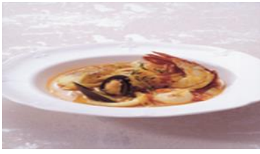
くろだ きよたか 黒田 清隆