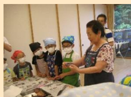
子ども達への食育教室