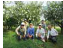
じょうとうかじゅ 上東果樹生産組合