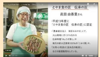
YouTubeレシピ動画への出演