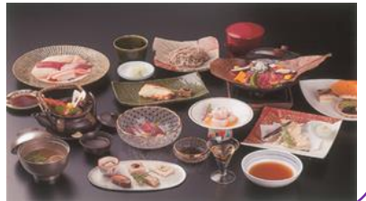
たなか いわお 田中 巖