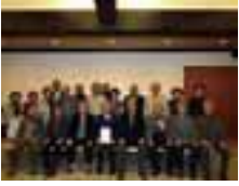
五箇山合掌 みょうが生産部会