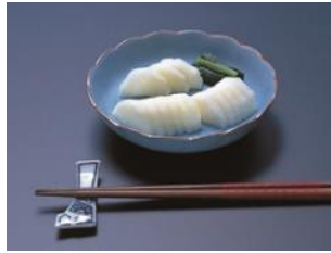
佐野つけもの教室 (佐野地区健康づくり推進協議会)