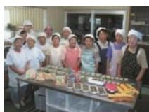
あじさい (農) 味彩おおやま