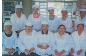
ひかり味噌加工組合