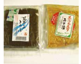
さいとう やすひろ 齊藤 靖弘