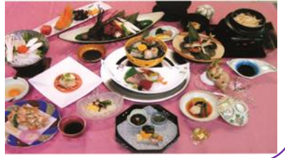
みねやま はやと 峯山 勇人