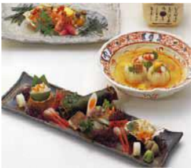
しま ただし 島 正