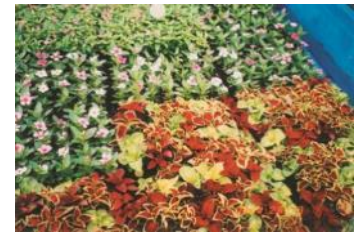
さくだ たつみ 作田 辰巳