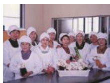
おとがわかこう (農) 音川加工