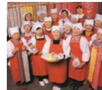
しよくさいこうぼう (農) 食彩工房たてやま