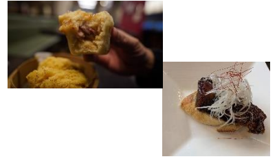
ゆあさ たかひと 湯浅 貴仁