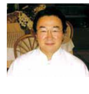
県産食材を使った西洋料理