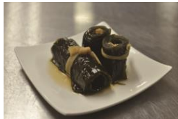
くろべ漁業協同組合 女性部