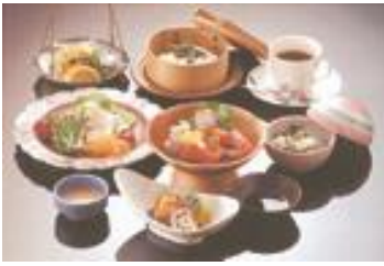
あおやま しげき 青山 繁樹