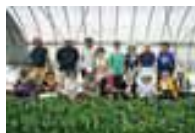
こまつな 菊ちゃんハウス