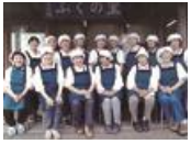
ふくの農産加工 運営協議会