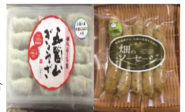
(農)五箇山特産組合 ねこのくら工房