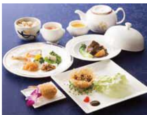
なかもと ひろゆき 中本 浩行