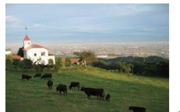
小矢部市 稲葉山牧場