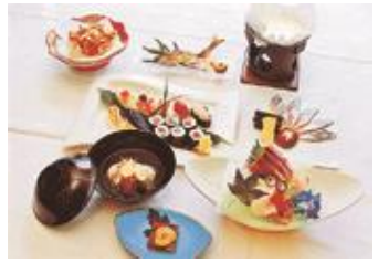
まつだ まさる 松田 勝