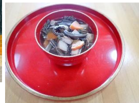
たてやまあしくら 立山芦峯女性の会