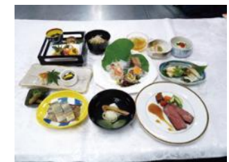
ふじもと しんじ 藤本 伸二