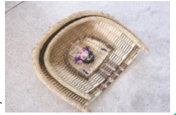
そうこうふじみ 双光藤箕生産組合