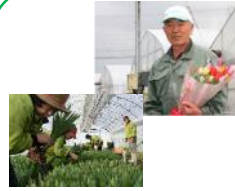
となみきりばな 砺波切り花研究会