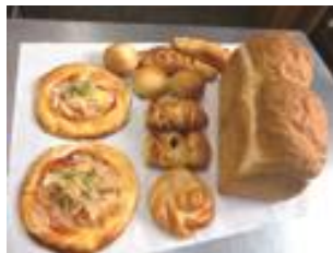
アグリピア パン工房