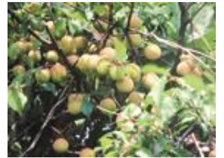
ひみいなづみうめ 氷見稲積梅(株)