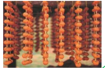
くめくしがき 久目串柿生産組合