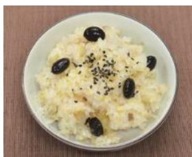
(農) うなづき食工房