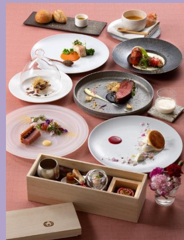
電気ビルディナー ～桜月～