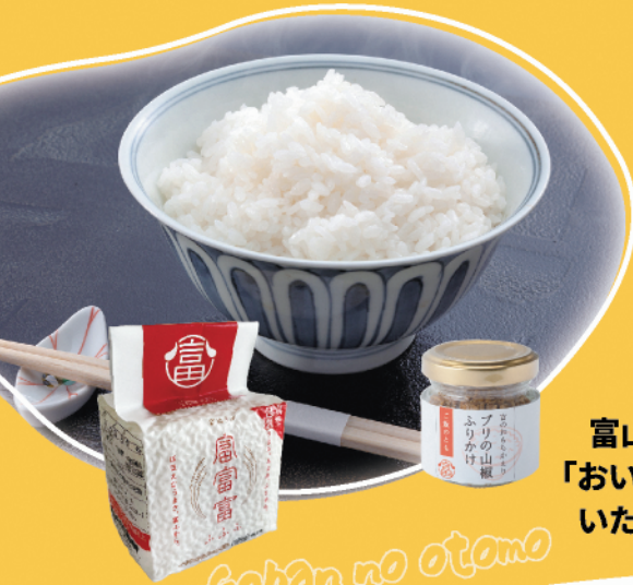
Gohan no otomo